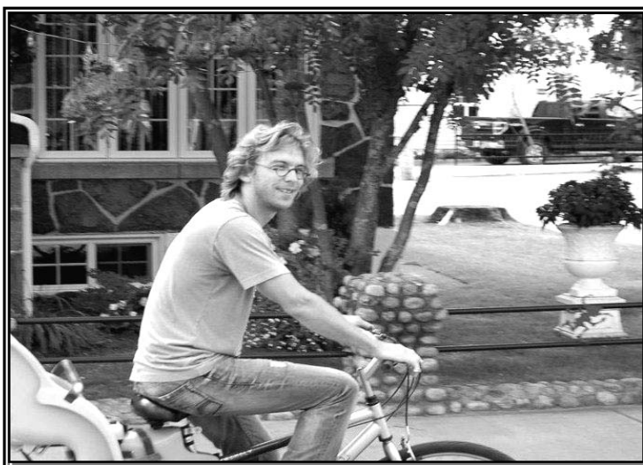
La vedette de St-Élie, Fred Pellerin, croqué sur le vif !