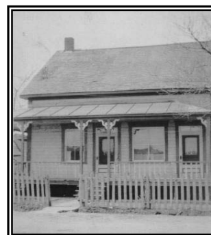
Maison familiale, chemin Sainte-Catherine, achetée en 1908.