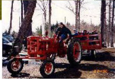
Ferme Martinette 1728, Chemin Martineau Coaticook, Qc